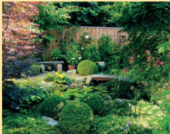
Vom Sitzplatz am Teich kann man gut die Pflanzen und Tiere am Ufer beobachten. Heft 5