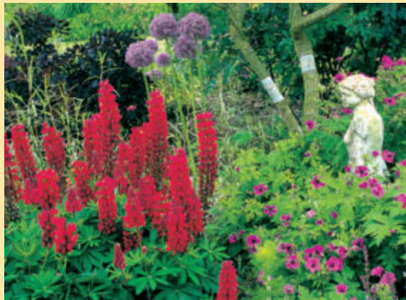
Feuerrote Lupinen sind der Blickfang in dieser Rabatte, da sieht selbst die Skulptur blaß aus. Heft 9