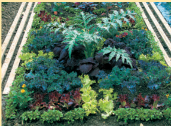
Geschmackvolle Mischkultur verschiedener Gemüsesorten. Heft 9