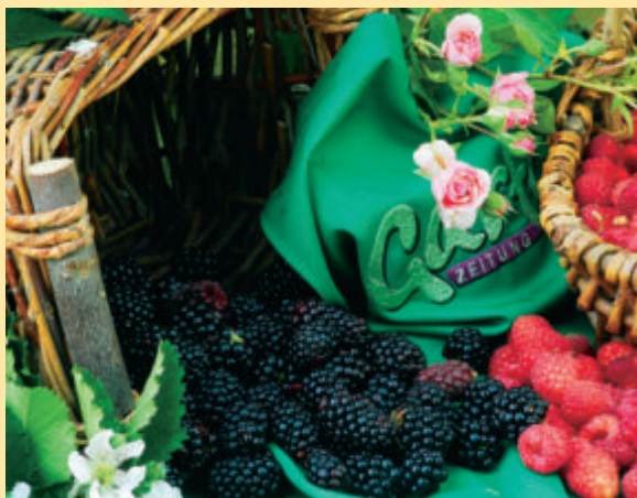
Himbeeren, Brombeeren. Zwei Beerenobst-Profis wissen Bescheid mit den beliebten Kulturen. Heft August