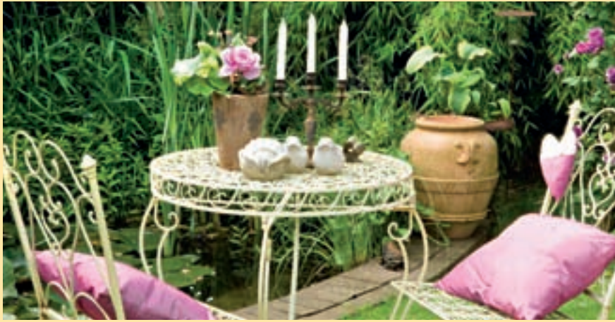
Für jede Tageszeit einen Sitzplatz. Und ein jeder ist ein Blickfang. Der Wohlfühlgarten von Brigitte und Udo Bergschneider in Heft 06/2010.