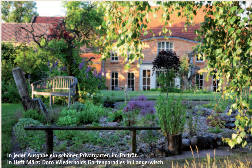
In jeder Ausgabe ein schöner Privatgarten im Porträt. In Heft März: Doro Wiederholds Gartenparadies in Langerwisch