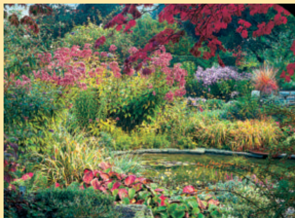
Wasserdost paßt zum Ufer von Teichen und Bächen. Heft 3