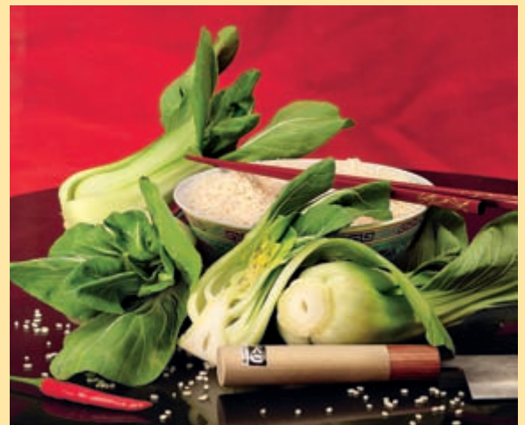
Salate, Gemüse und Kräuter für die Asia-Küche. Anbau- und Rezept-Tipps im Juniheft