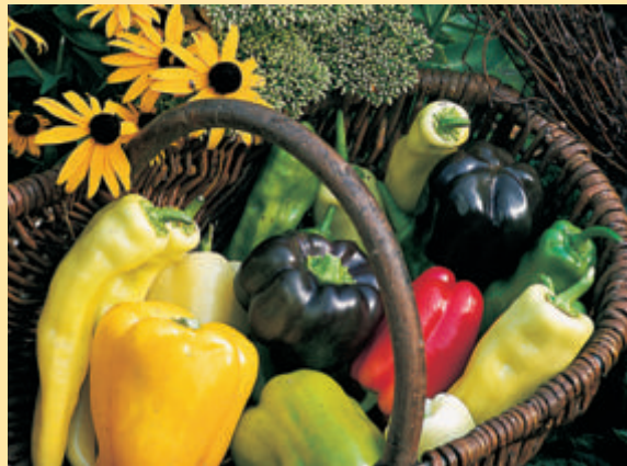
Reife rote, gelbe und schwarzviolette Paprika enthalten mehr Vitamin C als grüne. Heft 8