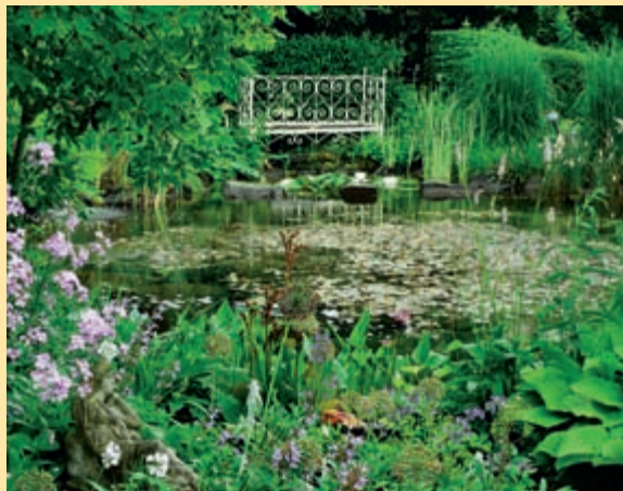
Traumhaft schöne Biotope. Gartenteich-Ideen zum Nachmachen. Pflanzpläne und mehr im Heft Mai