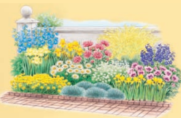
Rosa und Gelb? Passt das wirklich zueinander? Einblicke in die Lehre von den Gartenfarben finden Sie in unserer September-Ausgabe