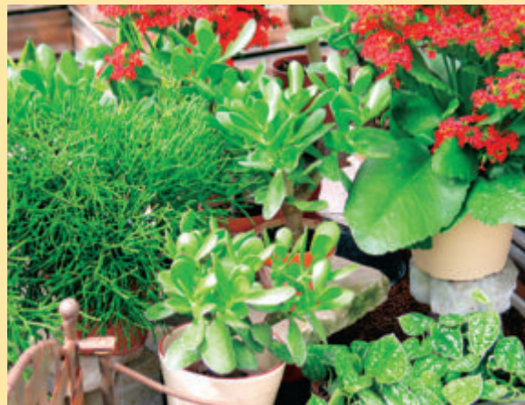
Blattsukkulente mit wasserspeichernden Blättern haben sich an trockene Standorte angepaßt. Heft 11