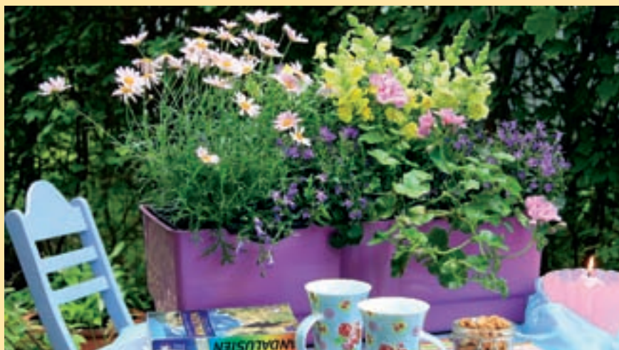
Neue Blütenstars, schicke Blattschönheiten, aromatische Kräuter. Alles für den Balkon. Beitrag aus dem Heft 05/2010