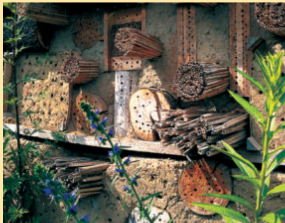
Insektenhotel: Quartier für nützliche Insekten. Bauleitung in Heft Februar