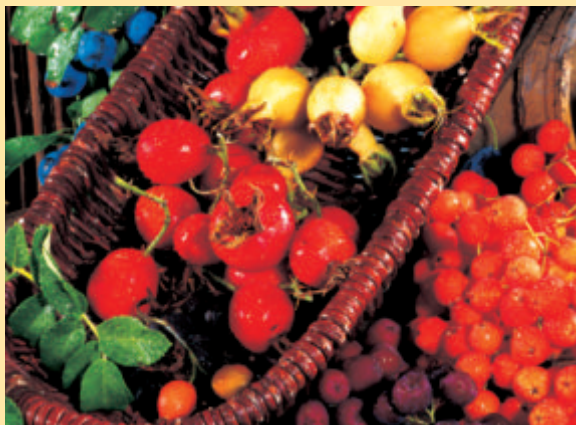
Hagebutten und andere Wildfrüchte beleben im Herbst den Garten. Heft 9