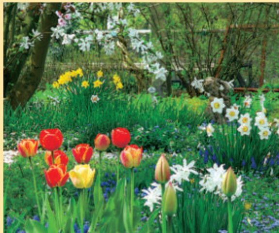
Frühlingsfest in allen Farben. Zwiebelblumen und Gehölze laufen zur Höchstform auf. Heft April