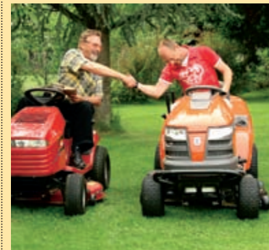
Das Traktoren-Rennen. Wer wurde Sieger im großen Aufsitzmäher-Test? Antworten im Juni-Heft